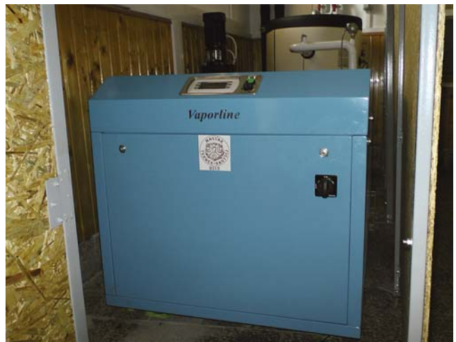
3. kép. Hőszivattyú az étkezőben

A fúrólyuk-hőcserélők egymástól 6,0 m-re helyezkednek el. Az 5 db fűrólyuk-hőcserélő vezeték (100 m mély, 32 mm-es szimpla U csöves földszondák) egyesítve ún. Tichelmann-rendszerű csőhálózaton keresztül jutnak a „hőközpontba”. A hőszivattyú egyesített gerincezetéke 75 mm átmérőjű, SDR11 minőségű PE 80-as műanyag cső. Az említett típusú hőszivattyú fűtési teljesítménye a tervezett legkisebb talajhőmérséklet szintjén, B 4 °C/W 62 °C: 35 kW.