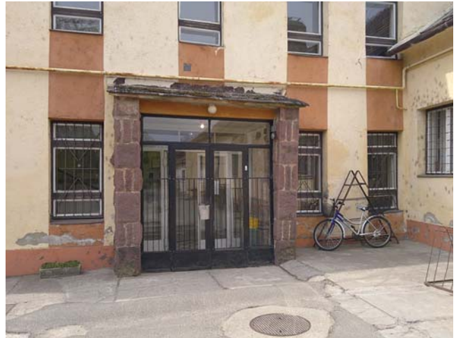
1. kép. Az épület főbejárati része korszerűsítés előtt

Az épületben már korábban is radiátoros központi fűtés működött, amelyet két földgázkazán látott el. A konyha résznek egy FÉG C-24 típusú 24 kW névleges teljesítményű, az Alsótagozatos Iskolának egy TERMO ÖV COLOR típusú, 52 kW névleges teljesítményű gázkazánja volt. A kazánokat a konyha épületrészben helyezték el, az Alsótagozatos Iskoláét az ebédlőben, a konyhait, pedig az irodahelyiségben. Az építészeti korszerűsítés (nyílászárócseré és hőszigetelés) során a