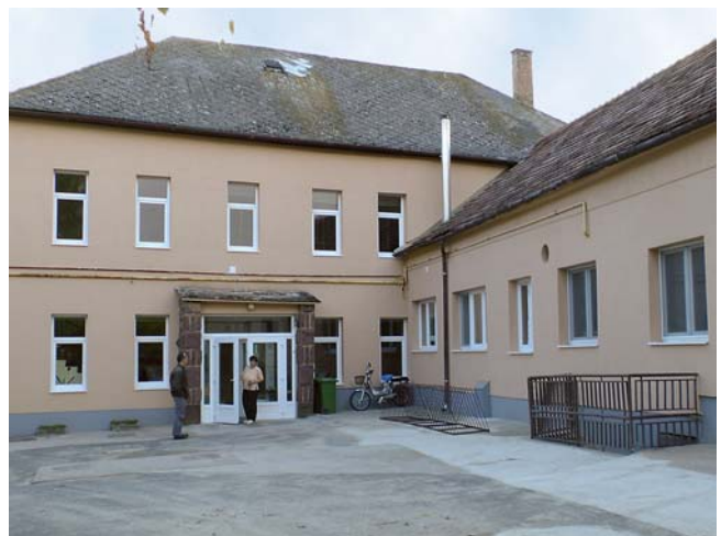
2. kép. Az épület főbejárati része korszerűsítés után

konyhai gázkazánt megszüntették, az iskolai gázkazán megmaradt tartaléknak, a két fűtőberendezés alapvezetékeit pedig egyesítették.