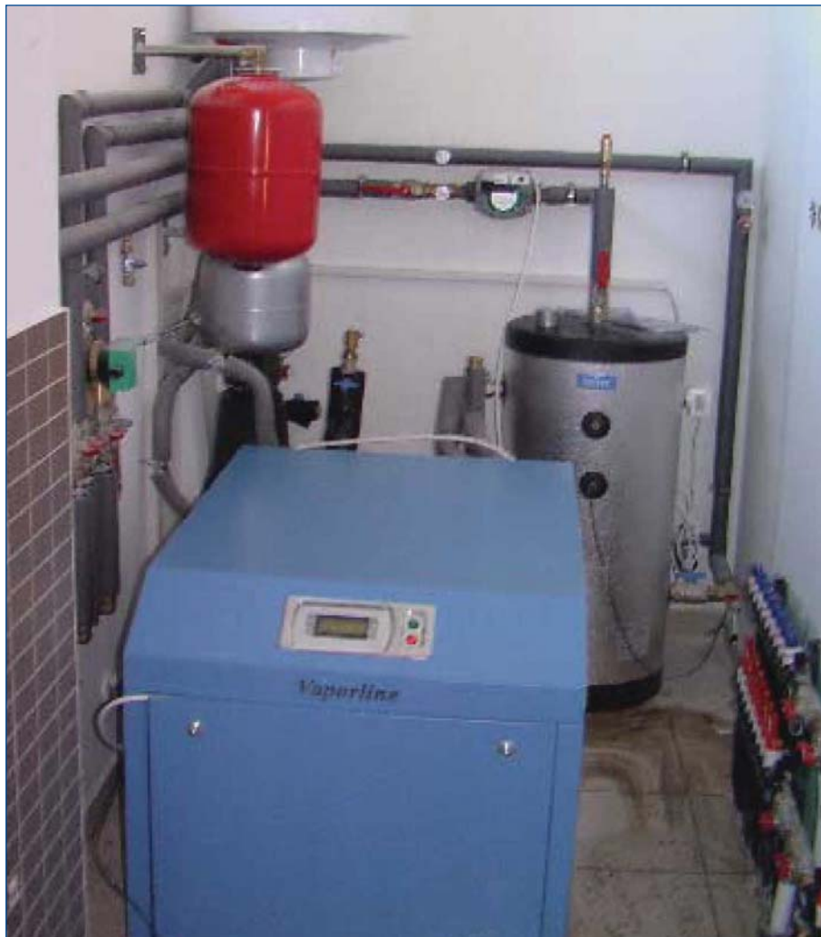
4. ábra. Budakalászi meglévő lakóépület hőszivattyús hőközpontja