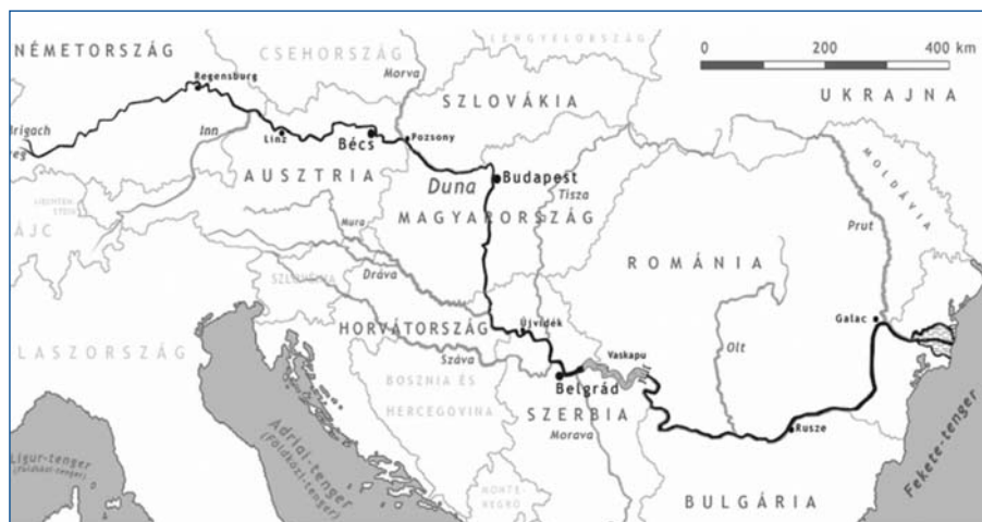
2. ábra. Duna menti országok és fővárosaik (Bécs, Pozsony, Budapest, Belgrád)