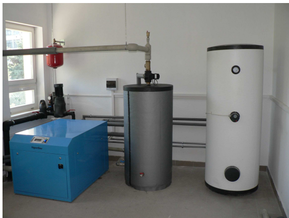
2. ábra. A hőszivattyú, hmv és fűtési puffertartály elhelyezése az intézmény hőközpontjában

Az épület padló- és falfűtése (falfűtése) nedves kivitelű melegvíz-üzemű sugárzófűtés. A fűtés és hűtés hőtermelője egy földhős (geotermikus) hőforrású villamos hőszivattyú, amely működése alatt egyúttal a hmv-t is biztosítja ( 2. és 3. ábra ).