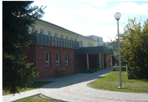
1. ábra. Tündérművelés Bölcsőde homlokzata (Sátoraljaújhely, Dózsa György u. 24.)

Magyarország első olyan családbarát bölcsődéje, ahol művészeti (zenei, irodalmi) nevelésben is részesülnek a gyermekek. A projekt az Új Széchenyi Terv pályázatán nyert 90%-os támogatást, a kedvezményezett: Sátoraljaújhely Város Önkormányzata volt, a létesítmény összesen 206 millió forintba került (kivitelezés ideje: 2010.05.17.–2011.08.17.). 48 férőhelyes, kétszintes, teraszos kivitelű épület ( 1. ábra ) kerékpár és babakocsi tárolóval is rendelkezik.